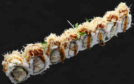
187. CHICKEN ROLL pollo fritto, philadelphia, teriyaki e kataifi € 11.00