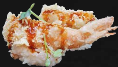
106. EBITEN gambero* fritto e teriyaki € 4.00