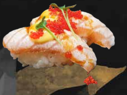
110. SAKE FLAMBÉ MANGO salmone scottato, salsa mango, teriyaki, mandorle e tobiko* € 4.00