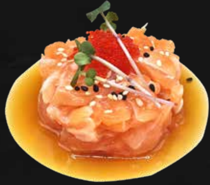
153. SALMONE tobiko*, sesamo e salsa ponzu € 7.00