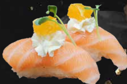
107. SAKE ORANGE salmone, philadelphia e arancia € 4.00