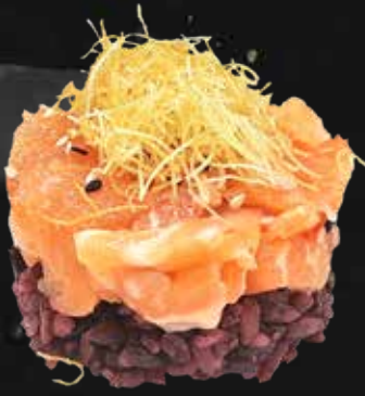
152. BLACK SALMONE riso venere, salmone, kataifi e teriyaki € 7.00