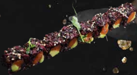
201. BLACK SAKE salmone, avocado e sesamo € 9.00