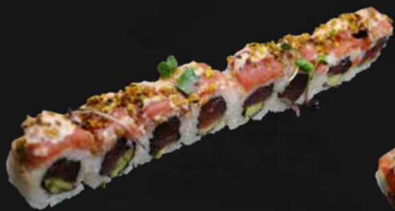
177. TUNA SPICY 🌶️ tonno, avocado, tonno macinato, salsa maionese spicy e pistacchio € 10.00