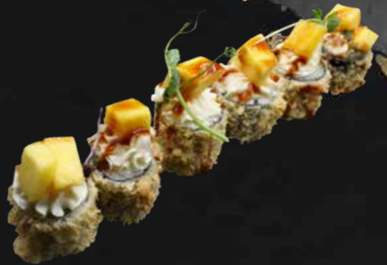
168. FRUIT FRITTO salmone, philadelphia con l'aggiunta di frutta e teriyaki € 7.00