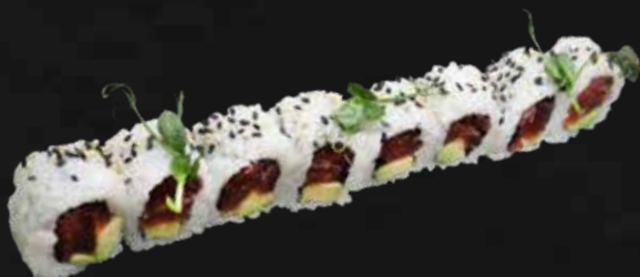
173. TUNA ROLL tonno, avocado e sesamo € 11.00