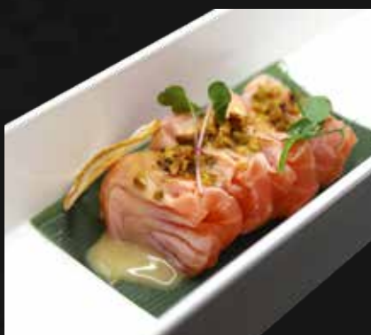
146. SALMONE SPECIAL 4PZ filetti di salmone scottato, salsa di latte, arachidi e pistacchio € 6.00