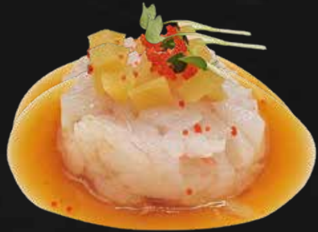
155. GAMBERO* gambero* rosa, tobiko*, rapa gialla e salsa ponzu € 8.00