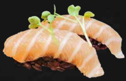
115. BLACK SAKE riso di nero e salmone € 3.00