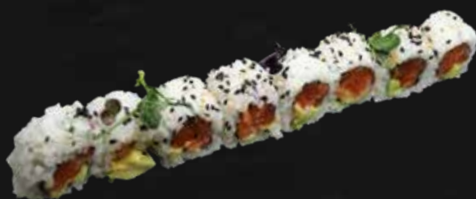
172. SAKE ROLL salmone, avocado e sesamo € 9.00