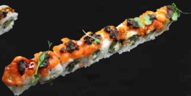
186. TARTUFO ROLL asparagi fritti, philadelphia, salmone macinato, teriyaki e tartufato € 11.00