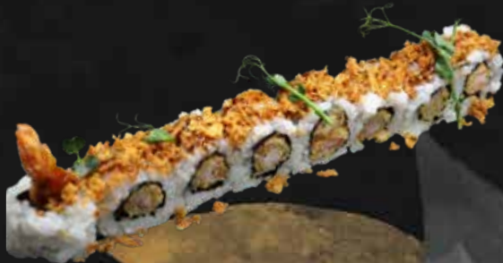
188. EBITEN ROLL gamberi* fritti, cipolla fritta e teriyaki € 11.00