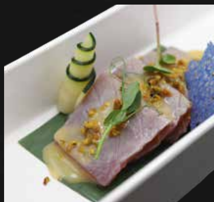
147. TONNO SPECIAL 4PZ filetti di tonno scottato, salsa di latte, arachidi e pistacchio € 7.00