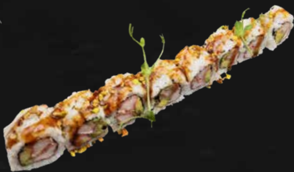
184. SURIMI FRITTO surimi fritti, avocado, maionese e pistacchio € 10.00