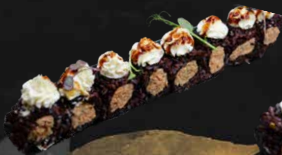
204. BLACK MIURA salmone cotto, philadelphia e teriyaki € 9.00