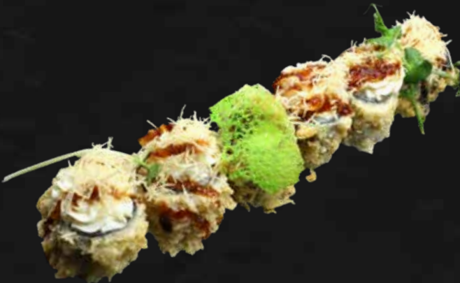
169. PHILA FRITTO salmone, philadelphia, teriyaki e kataifi € 7.00