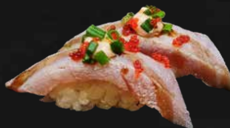
109. TUNA SPICY FLAMBÉ tonno scottato, teriyaki, maionese spicy, erba cipollina e tobiko* € 4.00