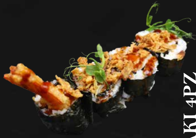
158. EBITEN tempura di gamberi*, avocado, teriyaki e cipolla fritta € 7.00