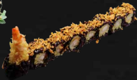
203. BLACK EBITEN gamberi* fritti, cipolla fritti e teriyaki € 11.00