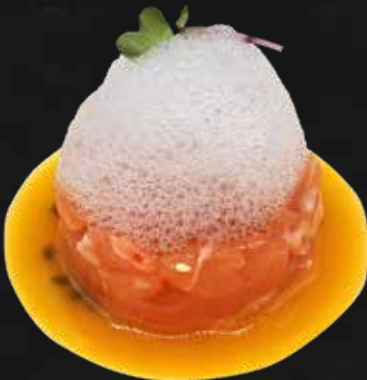
156. EXTRA SALMONE salmone, tobiko*, schiuma alimentare e salsa al frutto della passione € 10.00