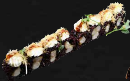
202. BLACK CHICKEN pollo fritto, philadelphia, teriyaki e kataifi € 11.00