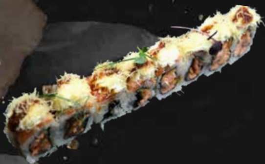
183. SALMONE FRITTO philadelphia, salmone fritto, salmone scottato, teriyaki e kataifi € 12.00