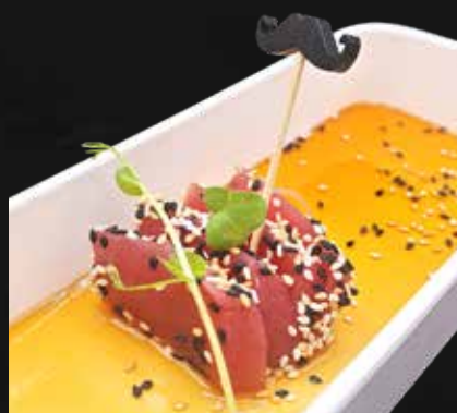
145. TONNO 4PZ filetti di tonno scottato, sesamo e salsa ponzu € 7.00