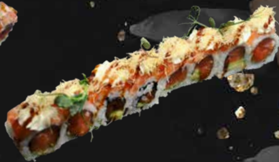
178. PHILA KATAIFI salmone, avocado, salmone affettato, philadelphia, teriyaki e kataifi € 11.00