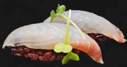
116. BLACK BRANZINO riso di nero e branzino € 3.00