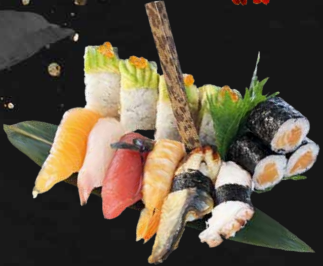
207. SUSHI PARTY 16PZ 6 nighiri, 6 hosomaki, 4 uramaki € 15.00