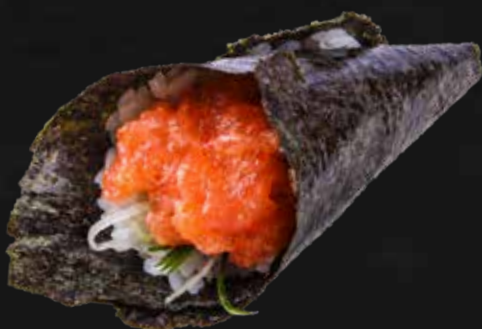
125. SPICY SAKE salmone, cetriolo e maionese piccante € 4.00