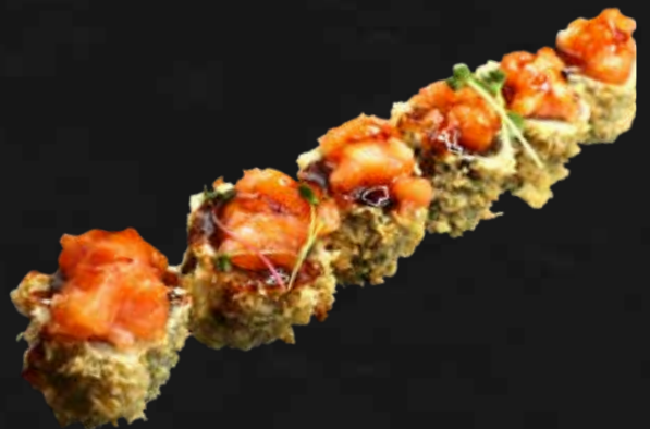
170. SAKE FRITTO salmone e teriyaki € 7.00