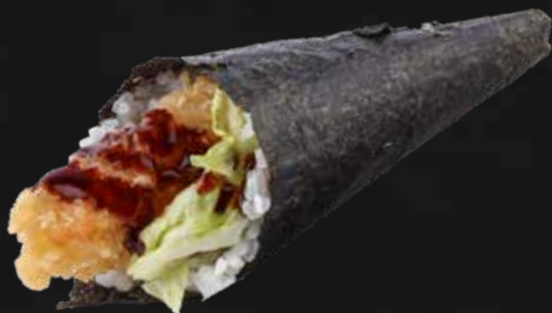
120. EBITEN gamberone* fritto, teriyaki e insalata € 3.50