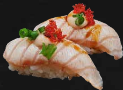
108. SAKE SPICY FLAMBÉ salmone scottato, maionese spicy, teriyaki, erba cipollina e tobiko* € 4.00