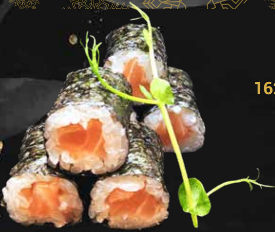
162. SAKE salmone € 4.00