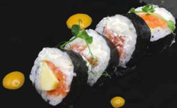
159. SAKE PHILA salmone, avocado e philadelphia € 6.00