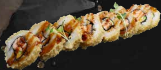
171. SAKE FRITTO salmone, avocado e teriyaki € 10.00