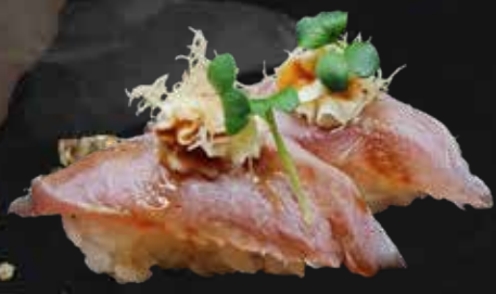
112. TONNO KATAIFI tonno scottato, teriyaki, philadelphia e kataifi € 4.00