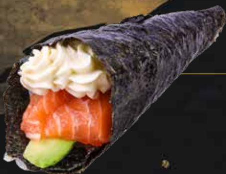
122. PHILADELPHIA philadelphia, salmone e avocado, € 3.50