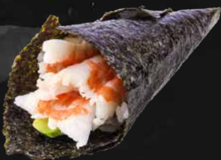
123. EBI gamberi* cotto con avocado € 3.50