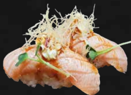
111. SALMONE KATAIFI salmone scottato, teriyaki, philadelphia, kataifi € 4.00