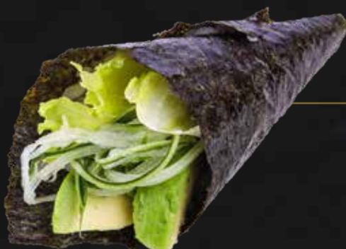
127. VEGAN insalata, cetriolo e avocado € 3.00