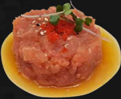
154. TONNO tobiko*, sesamo e salsa ponzu € 8.00