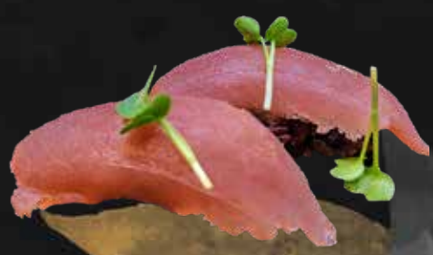
117. BLACK TUNA riso di nero e tonno € 4.00