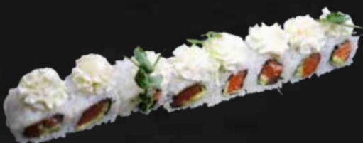
174. PHILADELPHIA salmone, avocado e philadelphia € 10.00