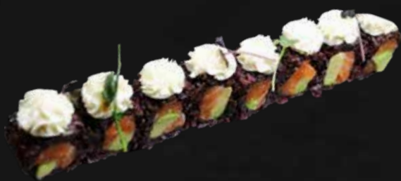
200. BLACK PHILADELPHIA salmone, avocado e philadelphia € 10.00