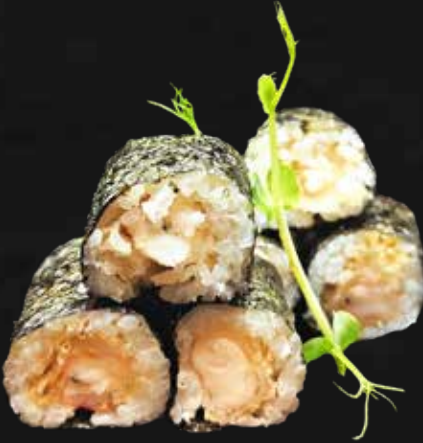
164. EBITEN gambero* tempura e teriyaki € 5.00