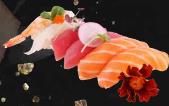
206. NIGHIRI MIX 6PZ 6 nighiri mix € 8.00