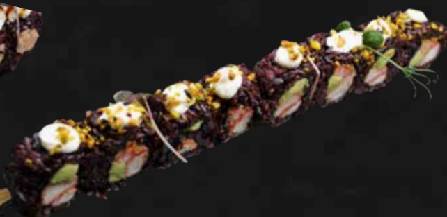
205. BLACK SURIMI surimi fritti, avocado, maionese e pistacchio € 10.00