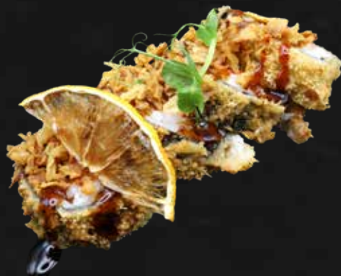
161. FRITTO salmone, philadelphia, cipolla fritta e teriyaki € 6.00