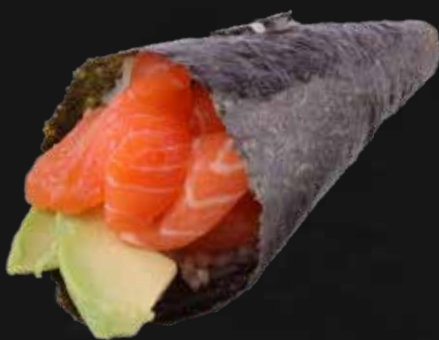
118. SAKE salmone e avocado € 3.00