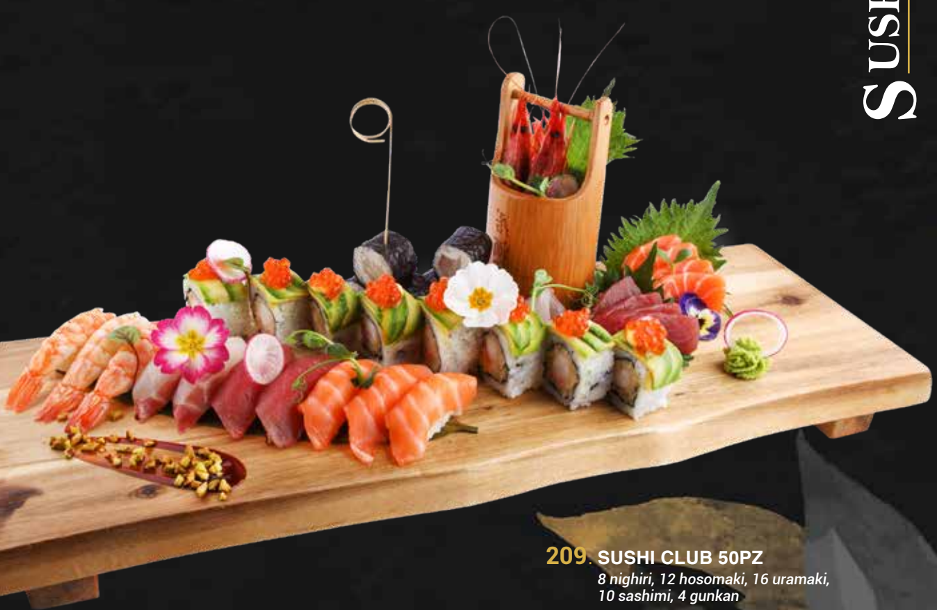
209. SUSHI CLUB 50PZ 8 nighiri, 12 hosomaki, 16 uramaki, 10 sashimi, 4 gunkan € 50.00