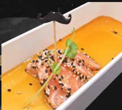
144. SALMONE 4PZ filetti di salmone scottato, sesamo e salsa ponzu € 6.00