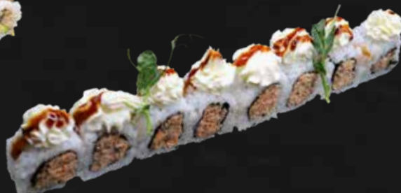
182. MIURA ROLL salmone cotto, philadelphia e teriyaki € 9.00