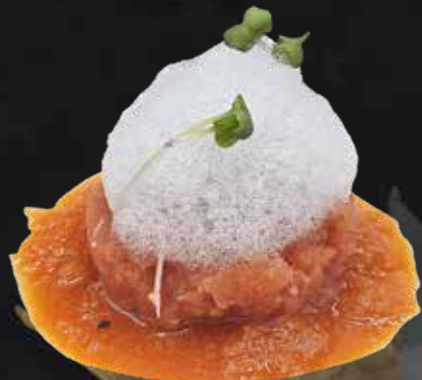
157. EXTRA TONNO tonno, tobiko*, schiuma alimentare e salsa di carote € 10.00