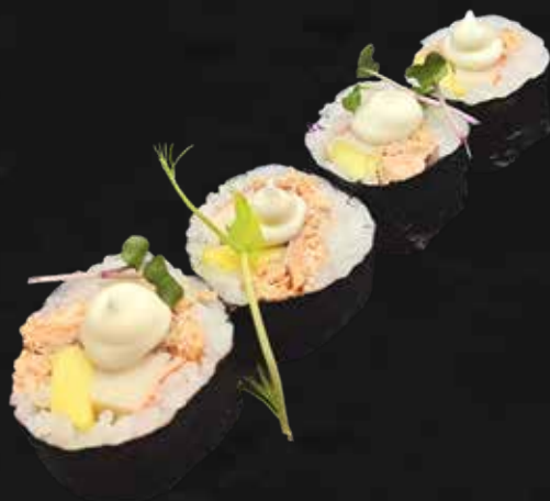
160. CALIFORNIA tonno cotto, granchio, avocado e maionese € 6.00