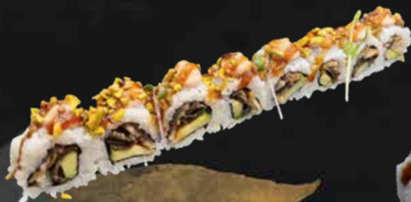
181. ANGUILLA ROLL 🌶️ anguilla, avocado, teriyaki, salsa mango, maionese spicy e pistacchio € 12.00