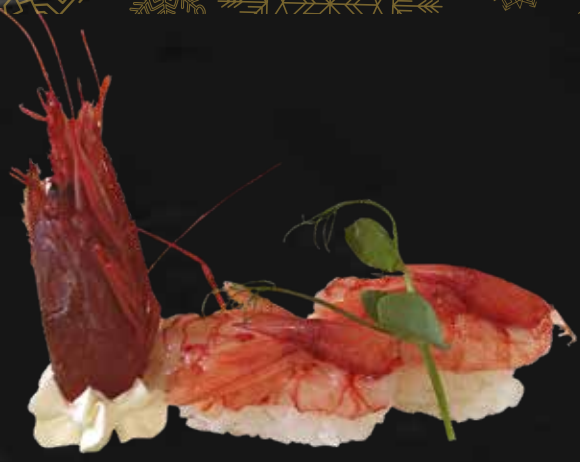
113. GAMBERO* CRUDO* gambero* rosso* crudo € 5.00