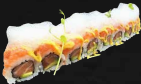
179. SAKE MANGO SPECIAL ROLL salmone, avocado, salmone macinato, salsa mango e schiuma alimentare € 13.00