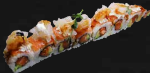
180. AMAEBI ROLL salmone, avocado, salmone affettato, philadelphia, amaebi e teriyaki € 13.00