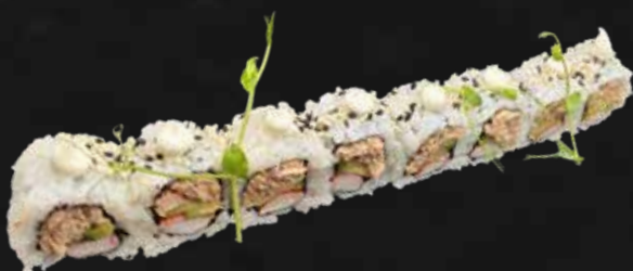
175. CALIFORNIA ROLL tonno cotto, surimi, avocado e sesamo € 10.00