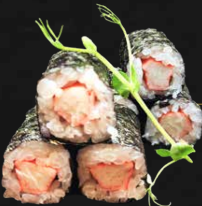
166. SURIMI surimi € 4.00