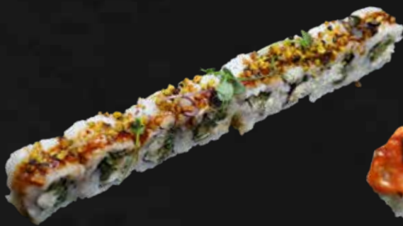
185. ASPARAGI ROLL asparagi fritti, philadelphia, teriyaki e pistacchio € 10.00