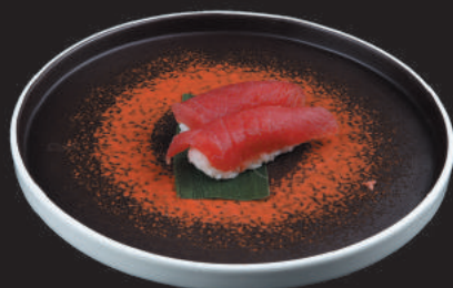
12. Tuna €3,00 tonno