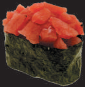
49. Nori Tuna €4,50 tartare di tonno, avvolto da alga nori