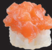
55. Nido Sake €4,50 salmone