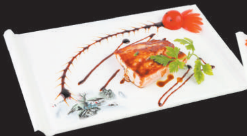
272 Salmon alla piastra €8,00 salmon, teriyaki, sesamo