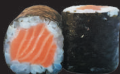
36. Sake €3,50 salmone

CILINDRI DI RISO CON PESCE RICOPERTI DA ALGA NORI - 6PZ