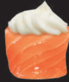
47. Philadelphia €5,00 philadelphia, avvolto da salmone