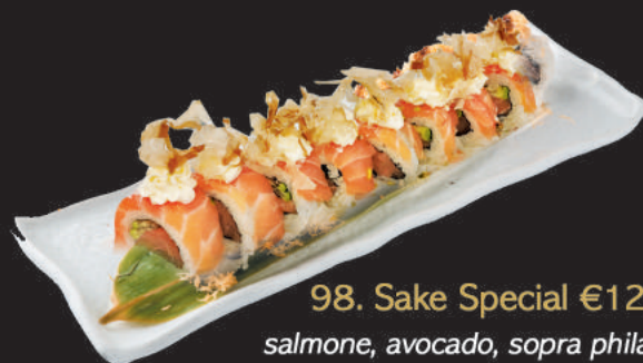
98. Sake Special €12,00 salmone, avocado, sopra philadelphia scaglie di pesce essiccato