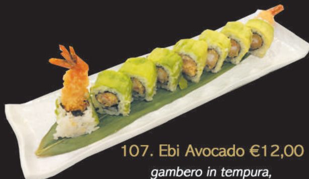
107. Ebi Avocado €12,00 gambero in tempura, sopra sashimi di avocado, teriyaki