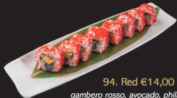
94. Red €14,00

gambero rosso, avocado, philadelphia sopra tobiko