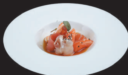
63. Carpaccio Pesce Misto €9,00 pesce misto, salsa ponzu, sesamo