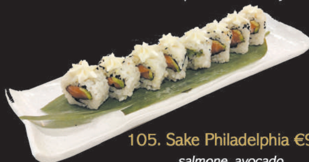
105. Sake Philadelphia €9,00 salmone, avocado, sopra philadelphia