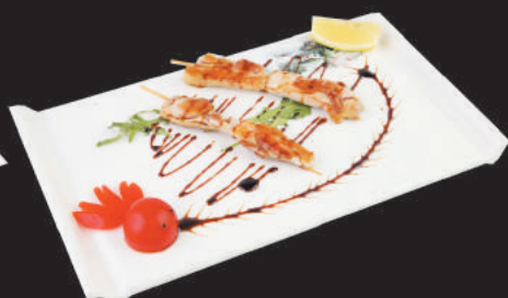
215 Spiedini di Pollo €3,00 2pz