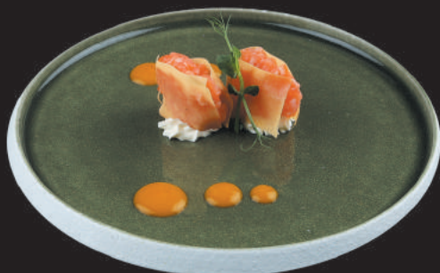
31. Sake €4,50 salmone, philadelphia, teriyaki