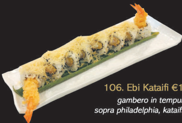
106. Ebi Kataifi €12,00 gambero in tempura, sopra philadelphia, kataifi, teriyaki