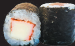
38. Kanikama €4,00 surimi di granchio