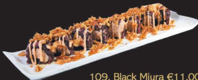
109. Black Miura €11,00 salmone cotto, maionese, sopra cipolla frita, salsa spicy