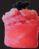
46. Spicy Tuna €5,00 tartare di tonno, spicy, tobiko, avvolto da tonno