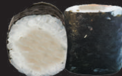
39. Suzuki €4,00 branzino