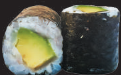
40. Avocado €3,50 avocado