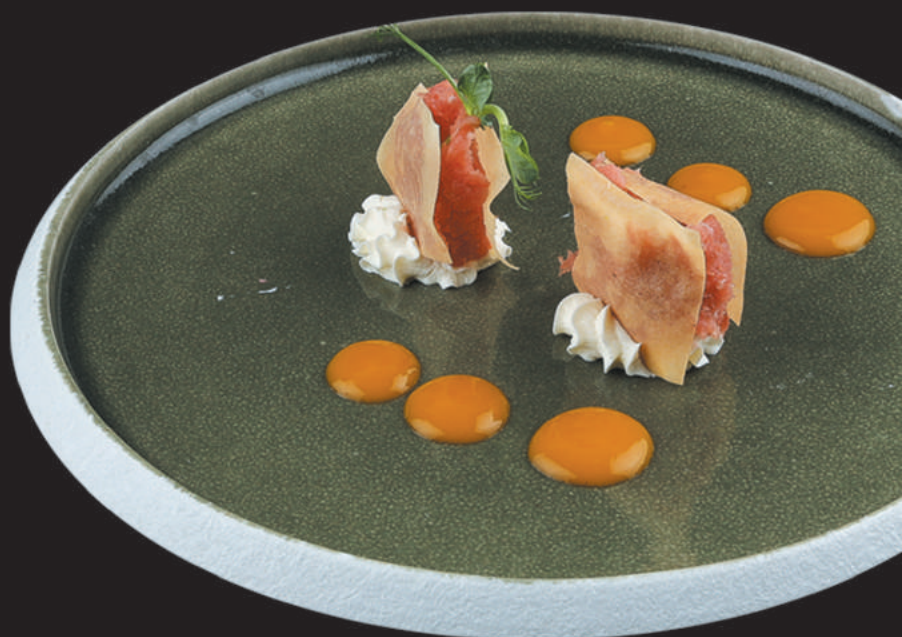
32. Tuna €4,50 tonno, philadelphia, teriyaki