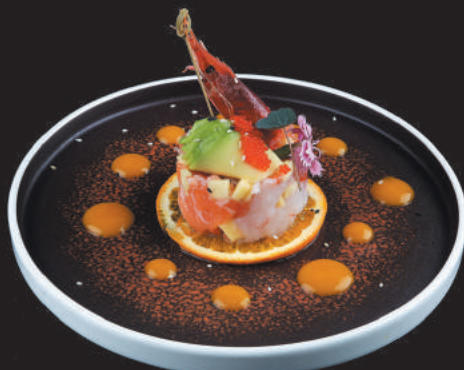
2. Tartare di Yuki €10,00 pesce misto con frutta di stagione, avocado, salsa ponzu