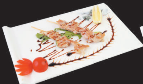
213 Spiedini di Maiale €2,50 2pz