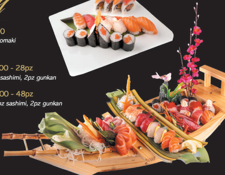
115. Barca Party Grande €45,00 - 48pz 16pz uramaki, 6pz nigiri, 12pz hosomaki, 12pz sashimi, 2pz gunkan