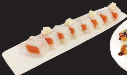
110. Fresh Roll €10,00 solo salmone senza alga, sopra philadelphia