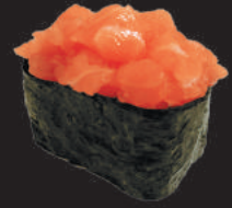
48. Nori Sake €4,00 tartare di salmone, avvolto da alga nori