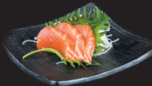
59. Sake €6,00 filetti di salmone