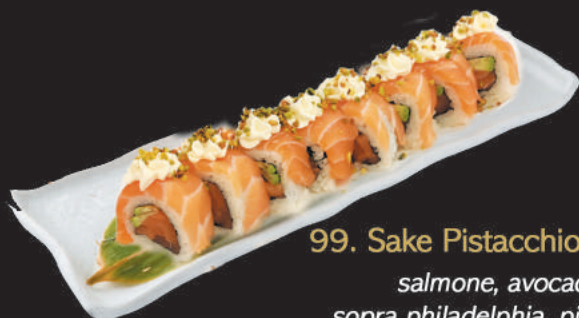
99. Sake Pistacchio €11,00 salmone, avocado, sopra philadelphia, pistacchio