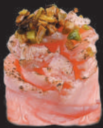
53. Sake Flambè €6,00 salmone flambè, teriyaki, pistacchio