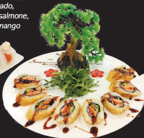
111. Fritto €12,00 salmone fritto, avocado, tutto fritto con salsa teriyaki