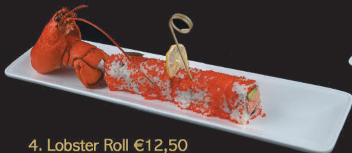
4. Lobster Roll €12,50 astice, avocado, maionese, tobiko, salsa mango