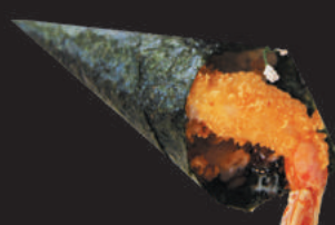
29. Tempura €3,50 gambero in tempura, philadelphia, teriyaki