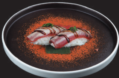
20. Tonno Scottato €3,50 tonno scottato, salsa teriyaki