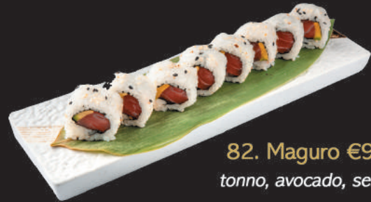
82. Maguro €9,50 tonno, avocado, sesamo