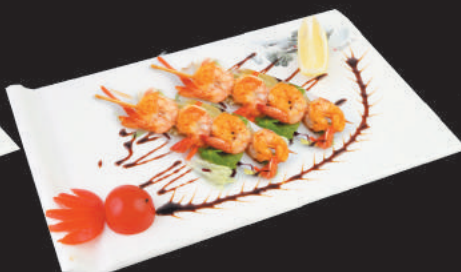
214 Spiedini di Gamberi €5,00 2pz