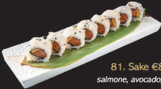
81. Sake €8,50 salmone, avocado, sesamo