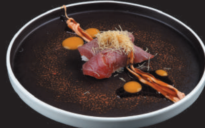
22. Tonno Scottato €4,50 tonno scottato, philadelphia, kataifi, teriyaki