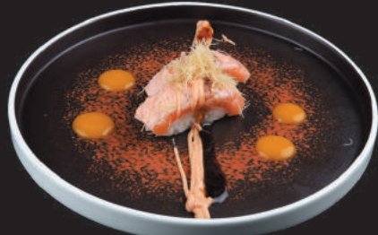
21. Salmone Kataifi €4,00 salmone scottato, philadelphia, kataifi, teriyaki