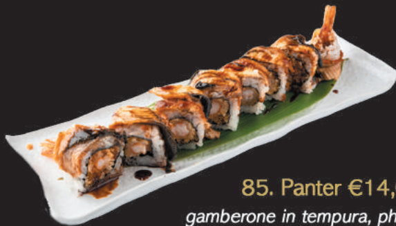
85. Panter €14,00 gamberone in tempura, philadelphia, sopra anguilla, teriyaki