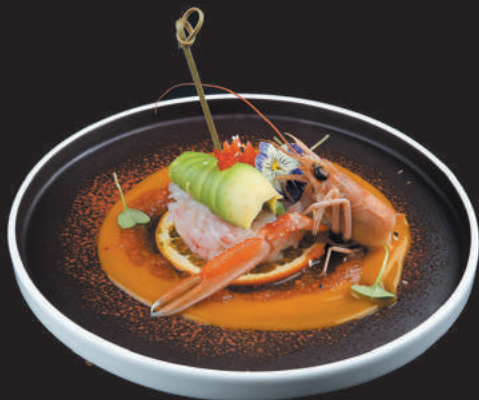
1. Tartare di Gamberi €12,00 gamberi, avocado, salsa ponzu

N.B. È POSSIBILE ORDINARE QUESTI PIATTI SPECIAL NEL MENÙ CENA SI PUÒ SCEGLIERE SOLO 1 PORZIONE PER OGNI PIATTO PER OGNI COMPONENTE