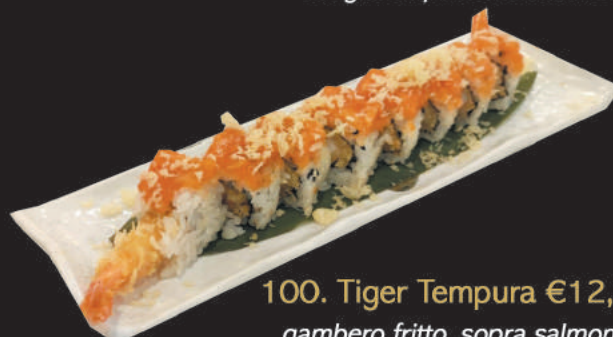
100. Tiger Tempura €12,00 gambero fritto, sopra salmone tempura e salsa teriyaki