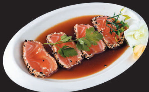
64. Salmone €8,00 filetti di salmone scottato, salsa sesamo e salsa ponzu