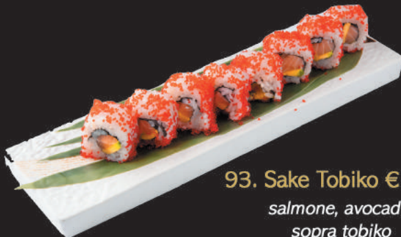
93. Sake Tobiko €13,00

salmone, avocado sopra salmone, philadelphia, mandorle