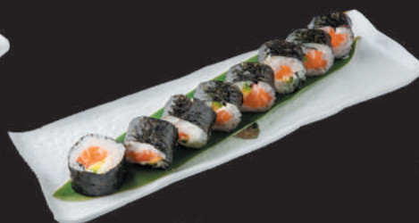
34. Sake €9,00 salmone, avocado, philadelphia