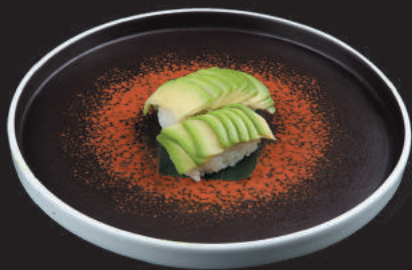
18. Avocado €2,50 avocado