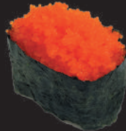
50. Nori Tobiko €4,50 tobiko, avvolto da alga nori