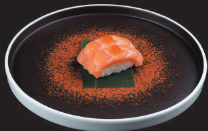
11. Sake €2,50 salmon