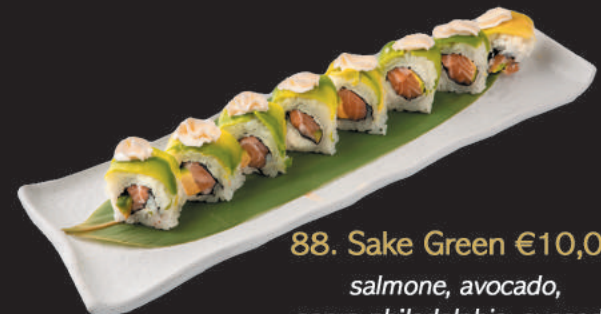
88. Sake Green €10,00 salmone, avocado, sopra philadelphia, avocado