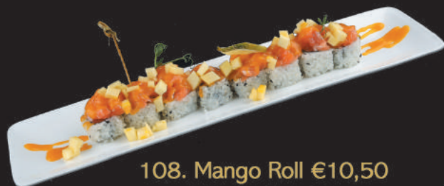
108. Mango Roll €10,50 salmone, avocado, esterno tartare di salmone, mango e salsa mango