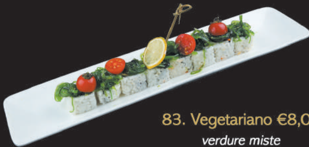
83. Vegetariano €8,00 verdure miste