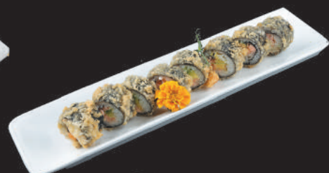
35. Fritto €10,00 salmone, avocado, philadelphia, teriyaki