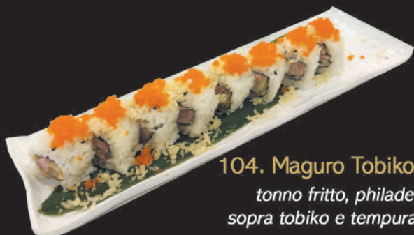
104. Maguro Tobiko €10,00 tonno fritto, philadelphia, sopra tobiko e tempura, teriyaki