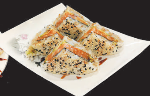
112. Sandwich - 4pz - €13,00 salmone, avocado, philadelphia, esterno sesamo e teriyaki