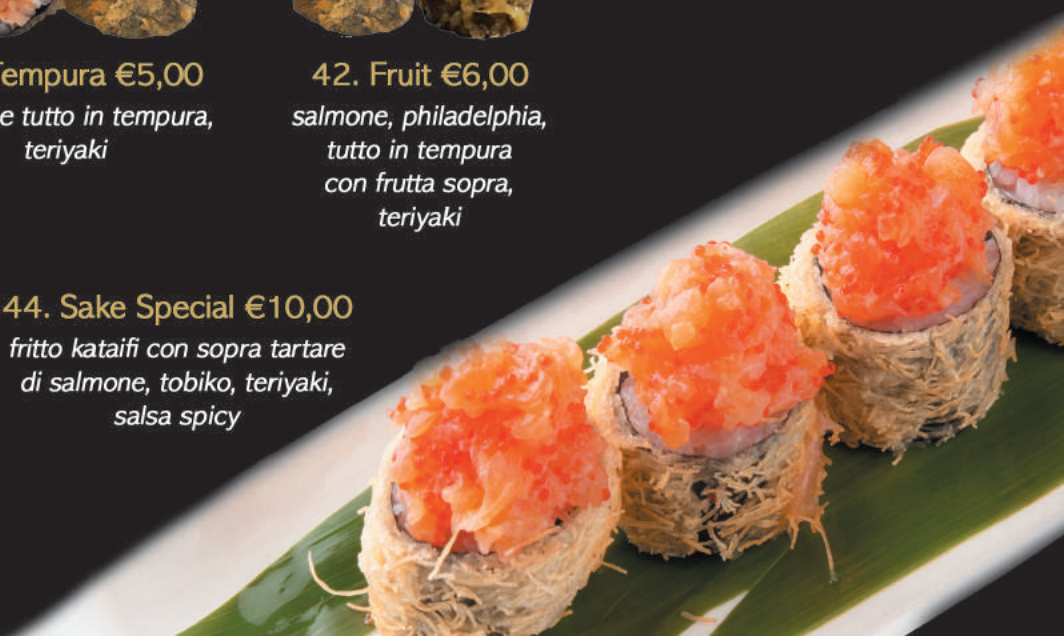
44. Sake Special €10,00 fritto kataifi con sopra tartare di salmone, tobiko, teriyaki, salsa spicy