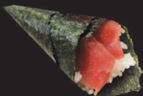
24. Tonno €3,00 tonno, avocado