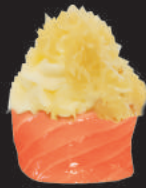
54. Kataifi €5,00 philadelphia, kataifi, avvolto da salmone, teriyaki