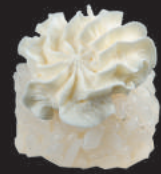
56. Nido Phila €4,00 philadelphia