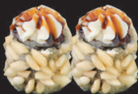
43. PopCorn Sake €5,00 salmone cotto, philadelphia, teriyaki, crispies