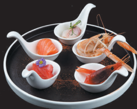
3. Cucchiaini misti €9,00 salmone, tonno, orata, gambero rosso, scampo