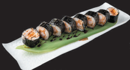
33. Ebi €11,00 gambero in tempura, teriyaki

ROLLS GRANDI FARCITI DI RISO E PESCE - 8PZ