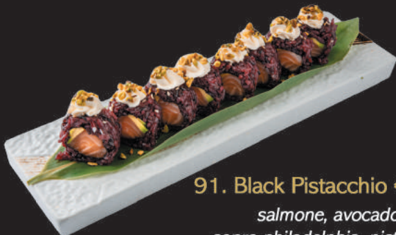
91. Black Pistacchio €11,00

pollo fritto, sopra kataifi e philadelphia