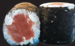
37. Teka €4,00 tonno