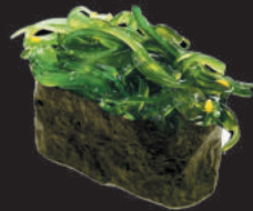
51. Nori Wakame €4,00 wakame, avvolto da alga nori