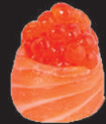
52. Ikura €5,00 uova di salmone, avvolto da salmone