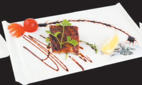
273 Tonno alla piastra €9,00 tonno, teriyaki, sesamo