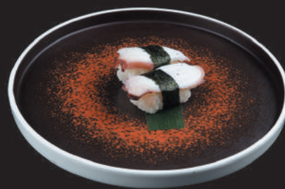
16. Polpo €2,50 polpo