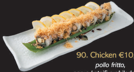
90. Chicken €10,00

gamberoni in tempura, sopra kataifi e teriyaki