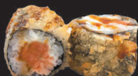
41. Tempura €5,00 salmone tutto in tempura, teriyaki