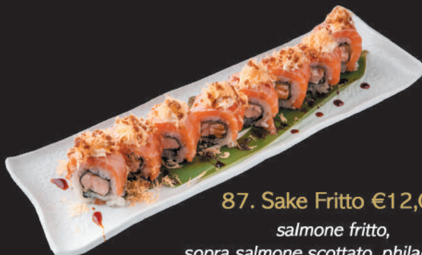
87. Sake Fritto €12,00 salmone fritto, sopra salmone scottato, philadelphia, kataifi e teriyaki