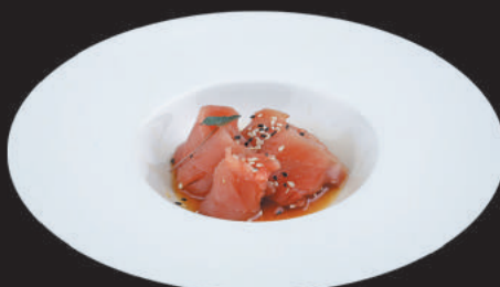
62. Carpaccio di Tonno €8,00 tonno, salsa ponzu, sesamo