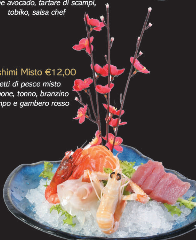
6 Sashimi Misto €12,00 filetti di pesce misto salmone, tonno, branzino scampo e gambero rosso