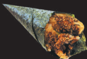
28. Salmone Fritto €3,50 salmone fritto, philadelphia teriyaki