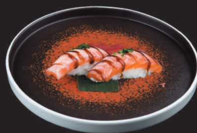
19. Salmone Scottato €3,00 salmone scottato, salsa teriyaki