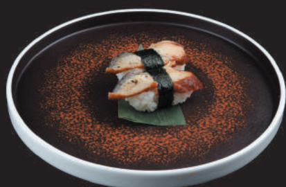
17. Anguilla €4,00 anguilla con salsa teriyaki