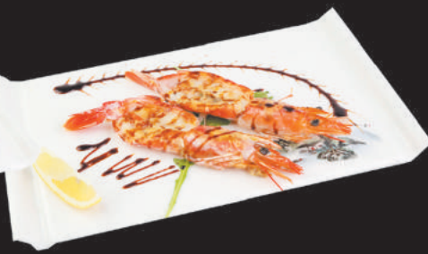
274 Gamberoni alla piastra €7,00 gamberoni, teriyaki, sesamo