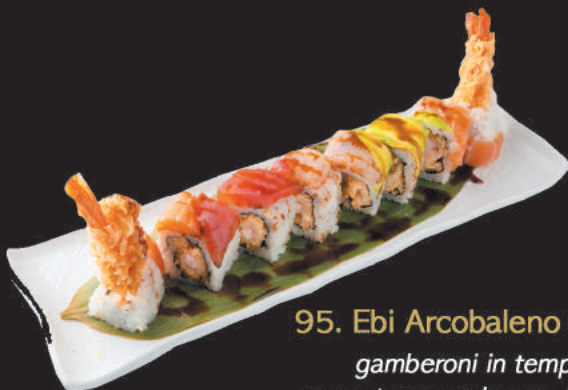
95. Ebi Arcobaleno €13,00

gambero rosso, avocado, philadelphia sopra tobiko