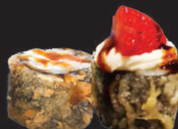
42. Fruit €6,00 salmone, philadelphia, tutto in tempura con frutta sopra, teriyaki