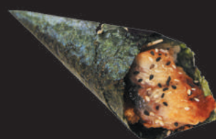
30. Anguilla €3,50 anguilla, teriyaki