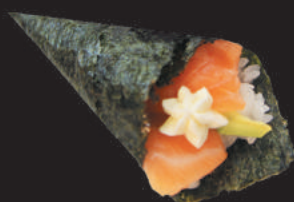
27. Salmone Phi €3,50 salmone, avocado, philadelphia