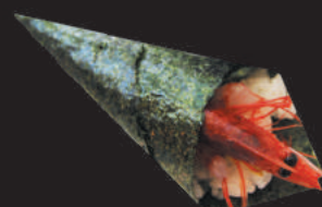
26. Gambero €4,00 gambero crudo, avocado