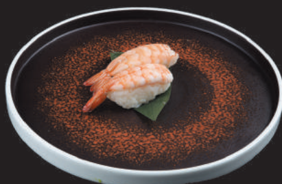
15. Gambero Cotto €3,00 gambero cotto