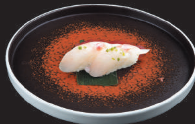
13. Branzino €3,00 branzino