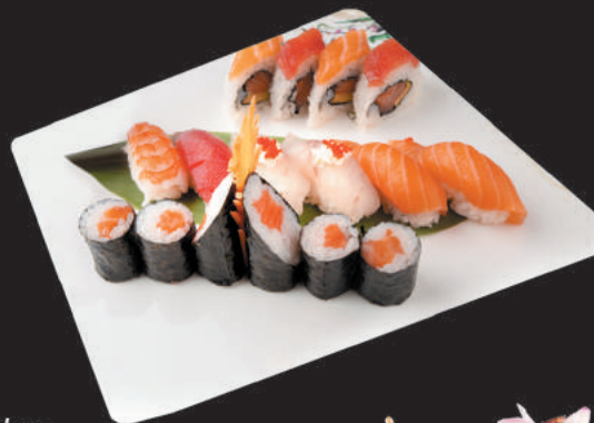
114. Barca Party Piccola €24,00 - 28pz 8pz uramaki, 6pz nigiri, 6pz hosomaki, 6pz sashimi, 2pz gunkan