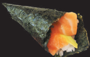
23. Salmone €3,00 salmone, avocado

CONO DI ALGA NORI FARCITO CON RISO E PESCE - 1PZ