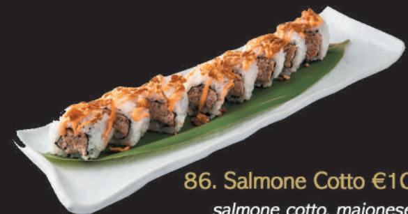
86. Salmone Cotto €10,00 salmone cotto, maionese, sopra cipolla fritta e spicy