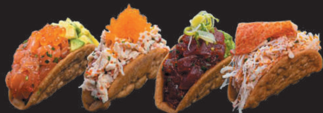
7. Sake Taco €3,00 salmone, mango, philadelphia,, uova di salmone