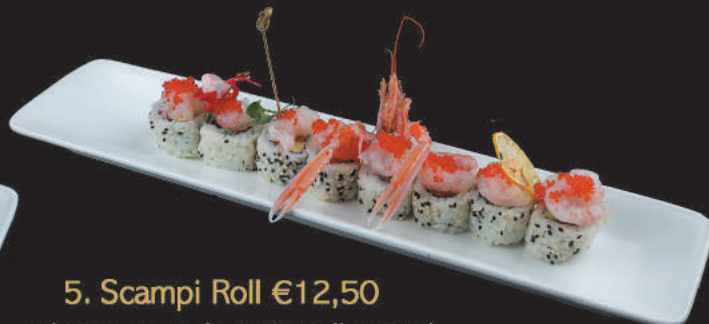
5. Scampi Roll €12,50 salmone avocado, tartare di scampi, tobiko, salsa chef