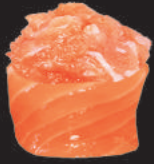
45. Spicy Sake €5,00 tartare di salmone, spicy, avvolto da salmone

RISO AVVOLTO DA PESCE O DA ALGA NORI GUARNITO SOPRA - 2PZ