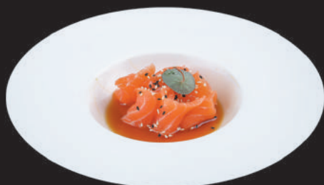
61. Carpaccio di Salmone €7,00 salmone, salsa ponzu, sesamo