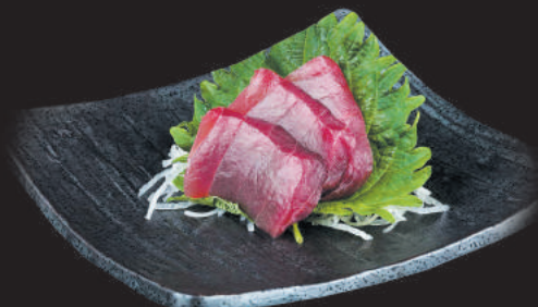
60. Tuna €7,00 filetti di tonno