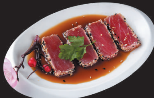
65. Tonno €9,00 filetti di tonno scottato, salsa sesamo e salsa ponzu