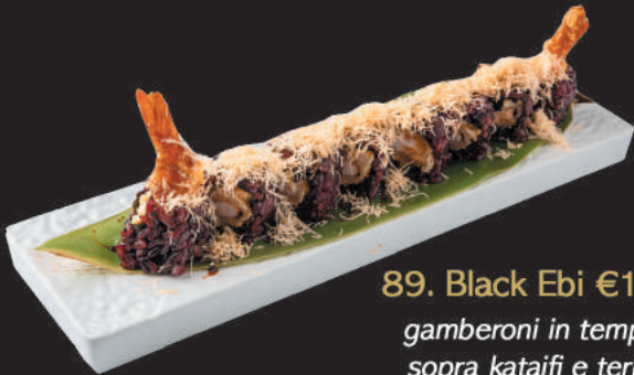
89. Black Ebi €12,00

gamberoni in tempura, sopra kataifi e teriyaki