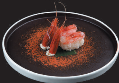
14. Gambero Rosso €3,50 gambero rosso