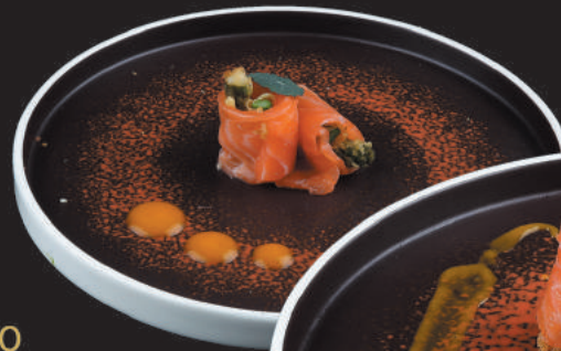
58. Ebiten €4,50 salmone, tempura di gamberi, philadelphia, salsa teriyaki