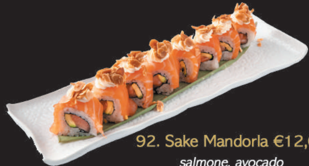
92. Sake Mandorla €12,00

salmone, avocado, sopra philadelphia, pistacchio