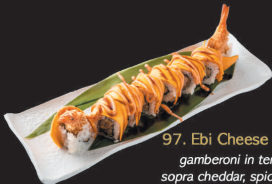
97. Ebi Cheese €12,00 gamberoni in tempura, sopra cheddar, spicy, teriyaki