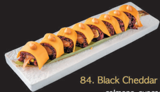
84. Black Cheddar €10,00 salmone, avocado sopra cheddar e spicy