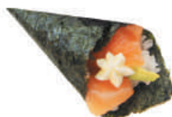
65.SALMONE PHI salmone, avocado, philadelphia, sesamo €3,00