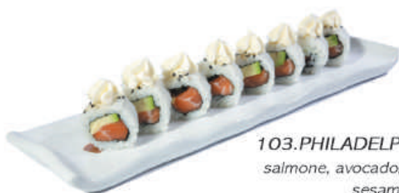
103.PHILADELPHIA ROLL salmone, avocado, philadelphia sesamo €9,00