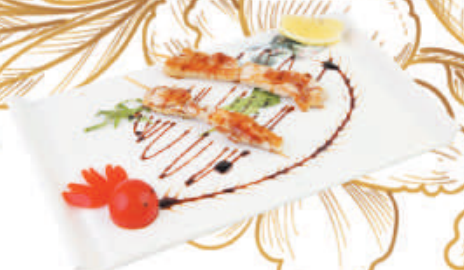
32. SPIEDINI DI POLLO