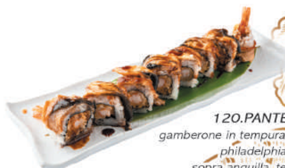
120.PANTER gamberone in tempura, maionese, philadelphia sopra anguilla, teriyaki €14,00