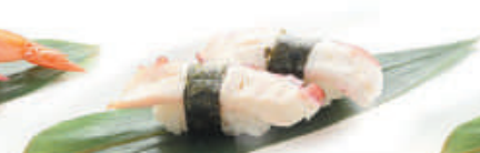
41.POLPO polpo €2,50