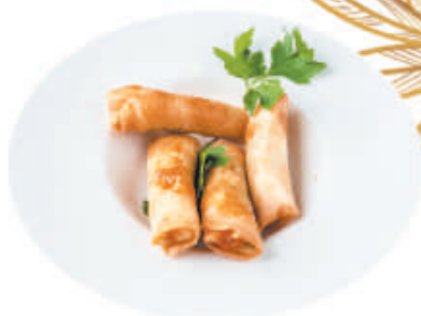
20. INVOLTINI DI GAMBERI gamberi e porro 4pz - €2,50