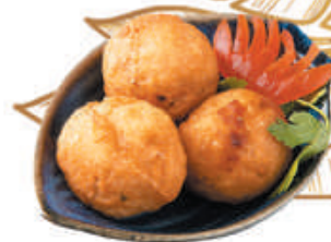
27. TOKAYAKI polpettine di polipo 2pz - €3,00