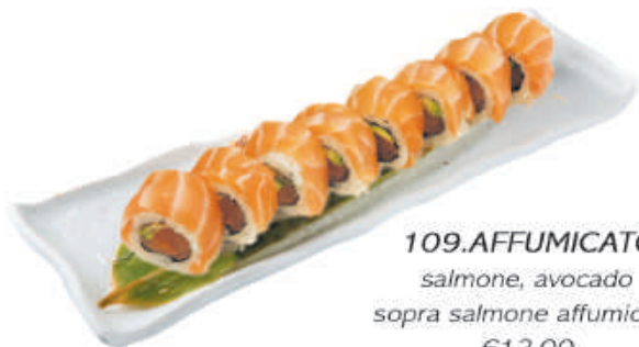
109.AFFUMICATO salmone, avocado sopra salmone affumicato €12,00