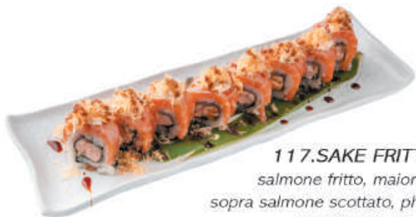
117.SAKE FRITTO salmone fritto, maionese, sopra salmone scottato, philadelphia, kataifi, teriyaki €12,00