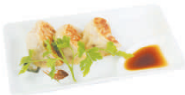
15. RAVIOLI BRASATI maiale, verdure 3pz - €2,50