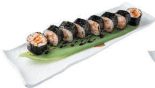
70. EBI gambero in tempura, salsa teriyaki €11,00