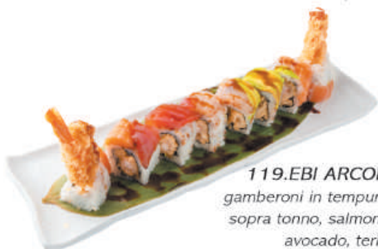
119.EBI ARCOBALENO gamberoni in tempura, maionese sopra tonno, salmone, branzino avocado, teriyaki €13,00