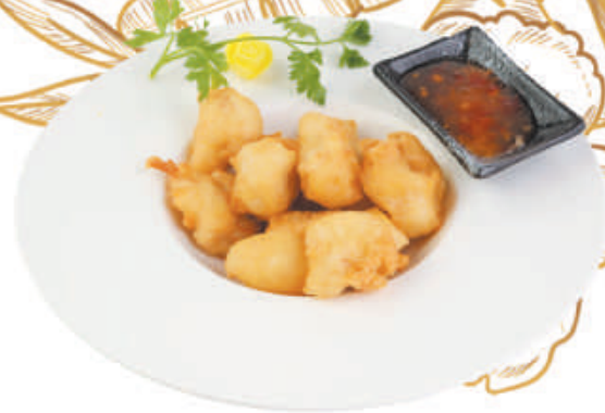
A47 POLLO FRITTO bocconcini di pollo fritti €4,50