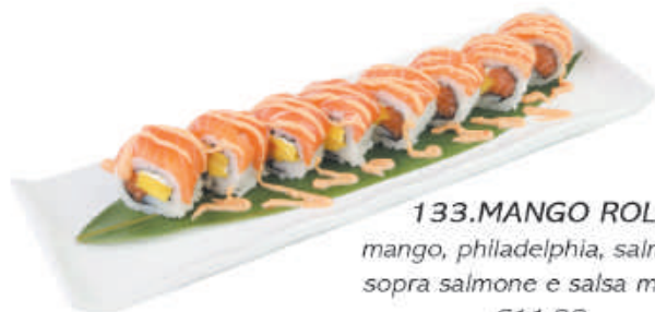
133. MANGO ROLL mango, philadelphia, salmone, sopra salmone e salsa mango €11,00