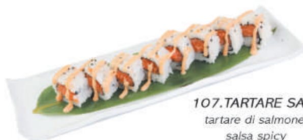
107.TARTARE SAKE tartare di salmone, salsa spicy €11,00