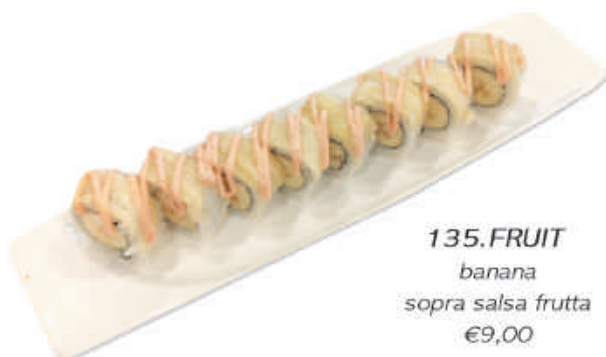
135. FRUIT banana sopra salsa frutta €9,00