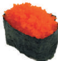
56.NORI TOBIKO tobiko, avvolto da alga nori €4,50