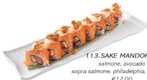
113.SAKE MANDORLA salmone, avocado sopra salmone, philadelphia, mandorle €12,00