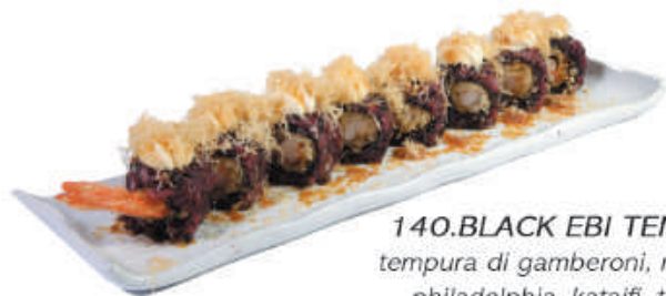
140. BLACK EBI TEMPURA tempura di gamberoni, maionese philadelphia, kataifi, teriyaki €11,00