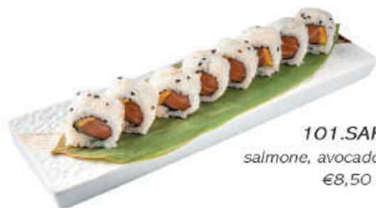
101.SAKE salmone, avocado, sesamo €8,50