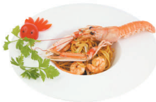
A24 Spaghetti saltati con Gamberi €5,00 gamberi, zucchine, carote, cipolla, porro, germogli di soia, uovo.