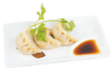
13. RAVIOLI AL VAPORE maiale, verdure 3pz - €2,50