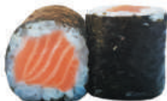
73. SAKE salmone €3,50

CILINDRI DI RISO CON PESCE RICOPERTI DA ALGA NORI - 6PZ