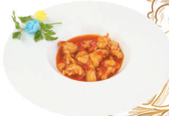
A48 POLLO COREANO pollo, peperoni, salsa piccante, cipolla, gamberi €5,00