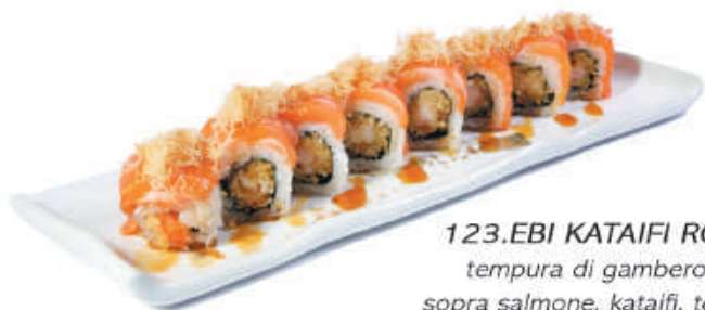
123.EBI KATAIFI ROLL tempura di gamberoni, sopra salmone, kataifi, teriyaki €11,00