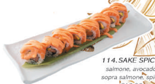
114.SAKE SPICY salmone, avocado sopra salmone, spicy €12,00