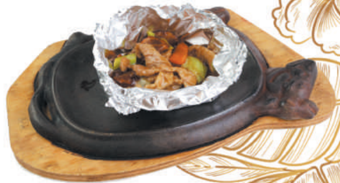
A62 MAIALE CON PATATE maiale, patate, carote, cipolla, porro €5,00