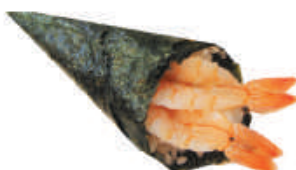
64.GAMBERO COTTO gambero cotto, avocado, sesamo €2,50