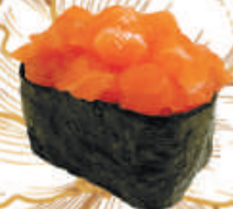
54.NORI SAKE tartare di salmone, avvolto da alga nori €4,00