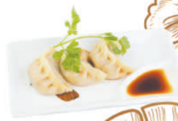
14. RAVIOLI DI POLLO pollo, verdure 3pz - €2,50