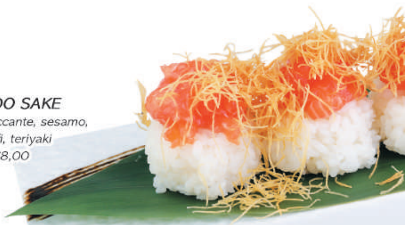
29. NIDO SAKE salmone piccante, sesamo, kataifi, teriyaki 2pz - €8,00