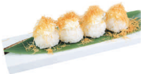
28. NIDO PHILA philadelphia, kataifi, teriyaki 2pz - €7,00