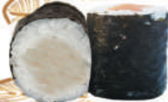
76. SUZUKI branzino €4,00