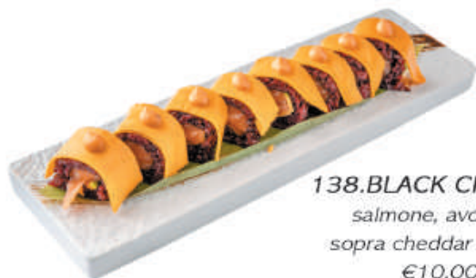
138. BLACK CHEDDAR salmone, avocado sopra cheddar e spicy €10,00