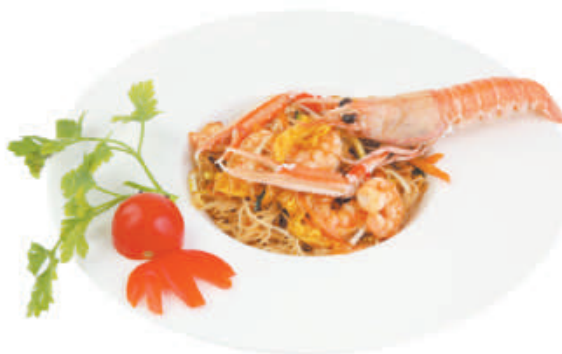
A31 Spaghetti di riso saltati € 3,50 zucchine, carote, cipolla, porro, germogli di soia, uovo.