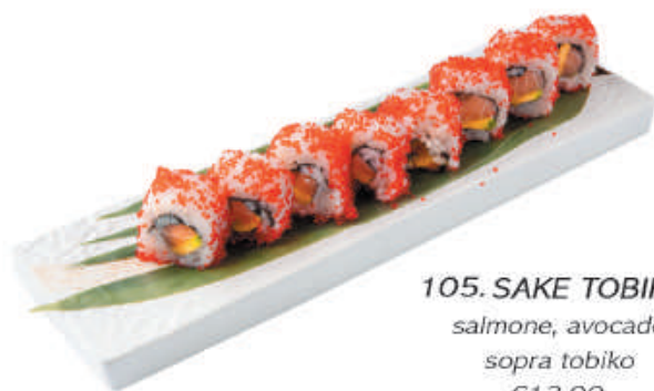
105.SAKE TOBIKO salmone, avocado sopra tobiko €12,00