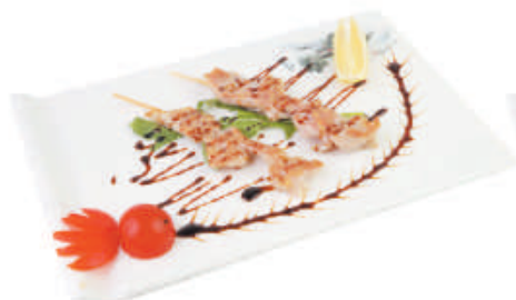
30. SPIEDINI DI MAIALE