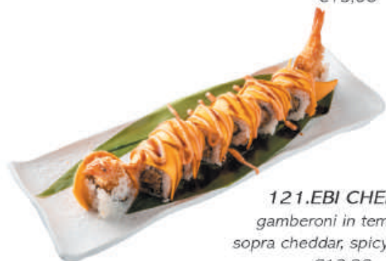
121.EBI CHEESE gamberoni in tempura, sopra cheddar, spicy, teriyaki €12,00