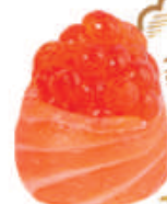
58.IKURA uova di salmone, avvolto da salmone €5,00