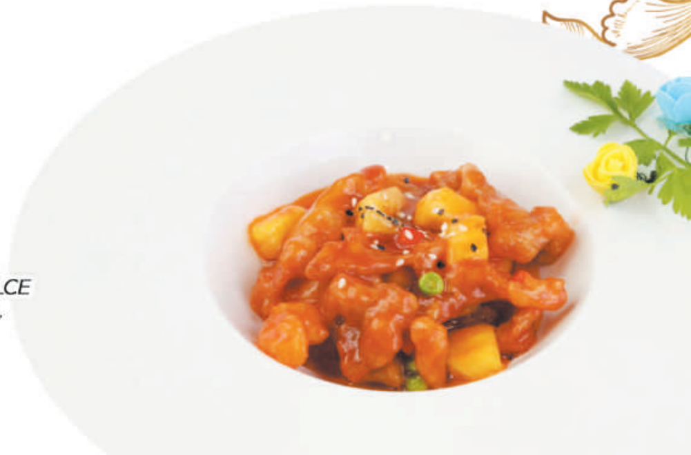
A61 MAIALE IN AGRODOLCE maiale, salsa agrodolce, piselli, peperoni, ananas €5,00