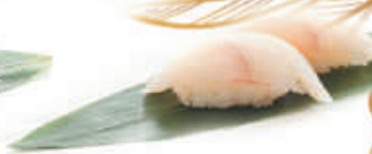
38.ORATA orata €3,00