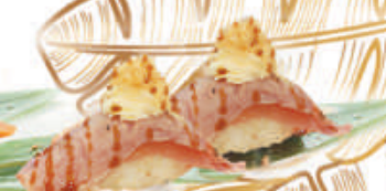
47.TONNO KATAIFI tonno scottato, philadelphia, kataifi, teriyaki €4,50