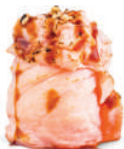
59.SAKE SCOTTATO tartare di salmone, avvolto da salmone, teriyaki, tutto scottato €6,00