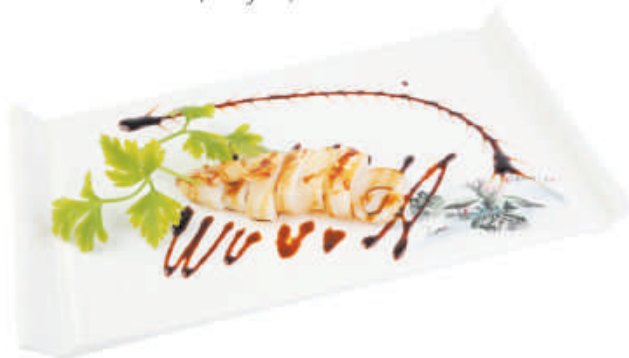
A75 Calamaro alla piastra €7,00 calamaro, teriyaki, sesamo