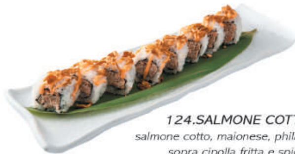
124.SALMONE COTTO salmone cotto, maionese, philadelphia sopra cipolla frita e spicy €8,50