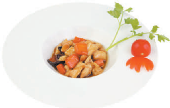
A44 POLLO ALLE MANDORLE pollo, mandorle, funghi, bambù, carote €4,50