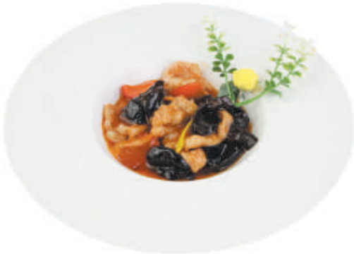
A63 MAIALE SALSA PICCANTE maiale, funghi cinesi, cipolla, peperoni, salsa piccante €5,00