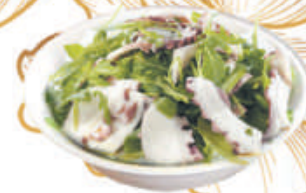
11. POLPO E RUCOLA polpo e rucola €5,00