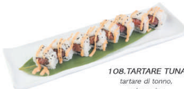
108.TARTARE TUNA tartare di tonno, salsa spicy €12,00