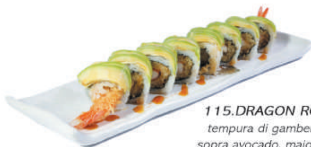
115.DRAGON ROLL tempura di gamberoni sopra avocado, maionese, teriyaki €11,00