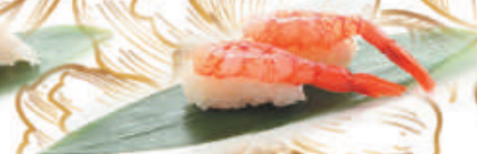
39.GAMBERO CRUDO gambero rosso crudo €3,50