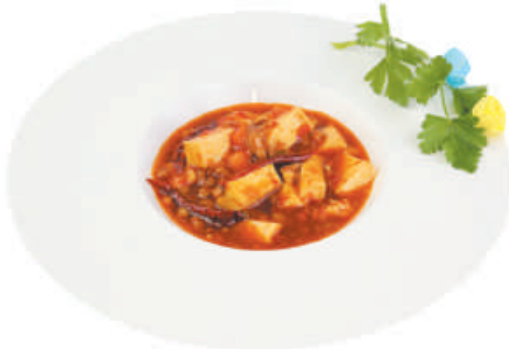
A81 MAIALE CON TOFU PICCANTE maiale tritato, tofu, salsa piccante €5,00