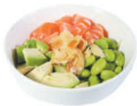
12. POKE SAKE salmone, avocado, cetriolo, soia, mandorle €10,00