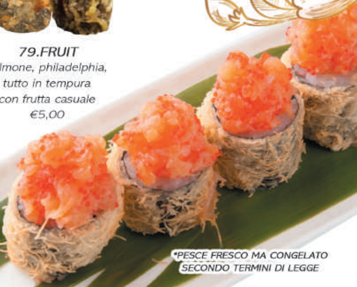
81. SAKE SPECIAL fritto kataifi con sopra tartare di salmone, tobiko, teriyaki €10,00

*PESCE FRESCO MA CONGELATO SECONDO TERMINI DI LEGGE