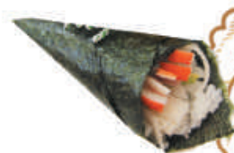
66.SURIMI surimi, avocado, sesamo €3,00