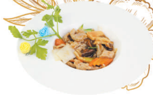
A60 MAIALE CON FUNGHI E BAMBÙ maiale, funghi, bambù, carote, cipolla, porro €5,00