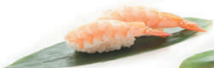
40.GAMBERO COTTO gambero cotto €3,00