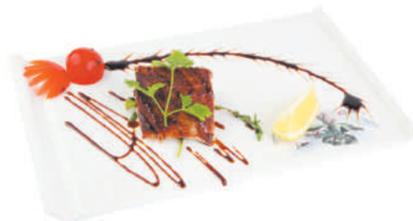
A73 Tonno alla piastra €9,00 tonno, teriyaki, sesamo