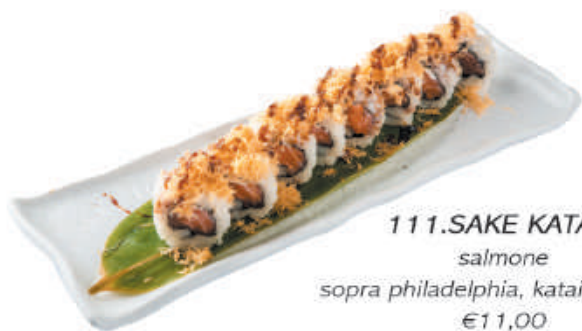
111.SAKE KATAIFI salmone sopra philadelphia, kataifi, teriyaki €11,00