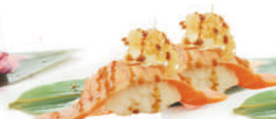
46.SALMONE KATAIFI salmone scottato, philadelphia, kataifi, teriyaki €4,00