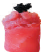
52.MAGURO SPICY tartare di tonno, spicy, tobiko, avvolto da tonno €5,00