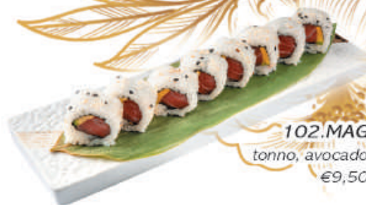
102.MAGURO tonno, avocado, sesamo €9,50