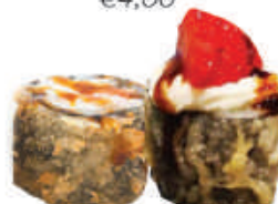
79. FRUIT salmone, philadelphia, tutto in tempura con frutta casuale €5,00