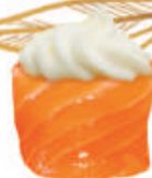
53.PHILADELPHIA philadelphia, avvolto da salmone €5,00