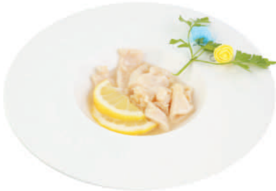
A51 POLLO IN SALSA LIMONE pollo, limone €5,00