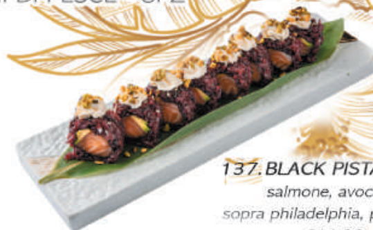
137. BLACK PISTACCHIO salmone, avocado sopra philadelphia, pistacchio €11,00