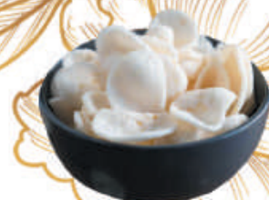
21. NUVOLETTE €1,50