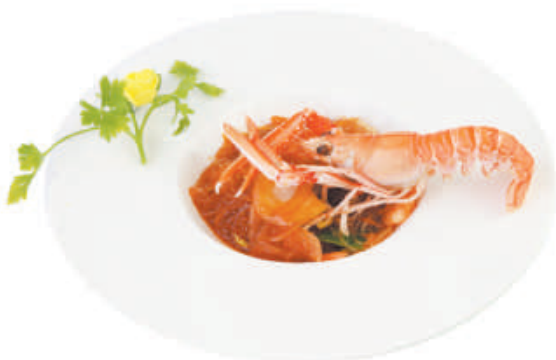
A27 Spaghetti di soia piccanti €3,50 salsa yuki n3, carne di maiale, peperoni, cipolla, salsa piccante.