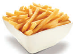
22. PATATINE FRITTE patatine €2,00