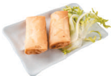
19 INVOLTINI PRIMAVERA verdure 2pz - €1,50