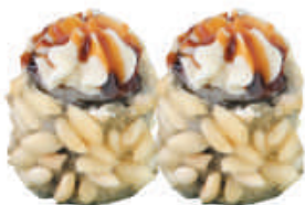
80. CRYSPY FRITTO salmone cotto, philadelphia, teriyaki, crispies €5,00