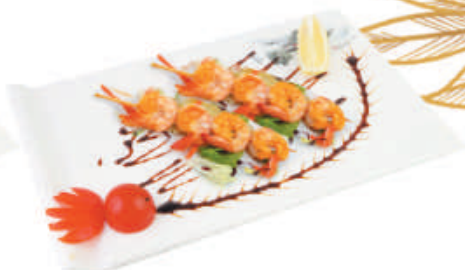
31. SPIEDINI DI GAMBERI