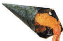
68.GAMBERO TEMPURA gambero in tempura, philadelphia, teriyaki, sesamo €3,50