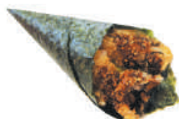
67.SALMONE FRITTO salmone fritto, philadelphia, teriyaki, sesamo €3,00