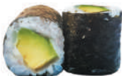
77. AVOCADO avocado €3,50