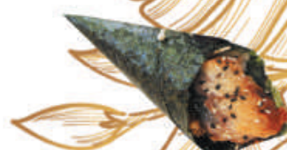
69.ANGUILLA anguilla, teriyaki, sesamo €3,50

*PESCE FRESCO MA CONGELATO SECONDO TERMINI DI LEGGE