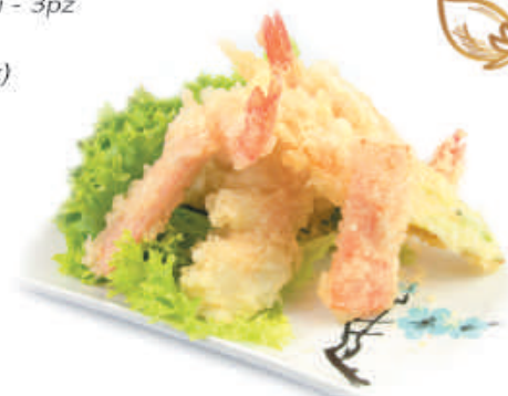
35. TEMPURA MISTA