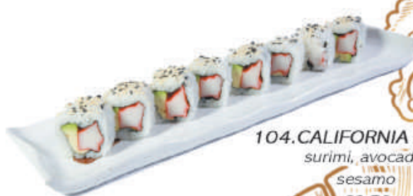
104.CALIFORNIA ROLL surimi, avocado, sesamo €8,50