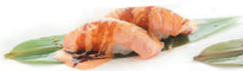
44.SALMONE SCOTTATO salmone scottato, teriyaki €3,00