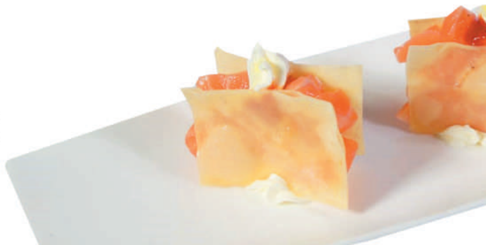
18. SAKE CRISPY salmone, philadelphia sfoglia 2pz - €5,00