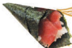
62.TONNO tonno, avocado, sesamo €3,00