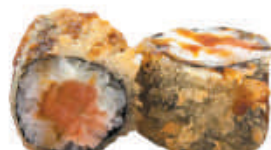
78. TEMPURA SALMONE salmone tutto in tempura, teriyaki €4,00