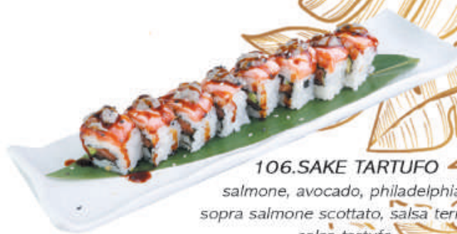
106.SAKE TARTUFO salmone, avocado, philadelphia, sopra salmone scottato, salsa teriyaki salsa tartufo €11,00