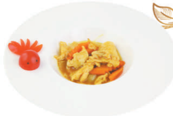
A46 POLLO AL CURRY pollo, carote, cipolla, curry €4,50