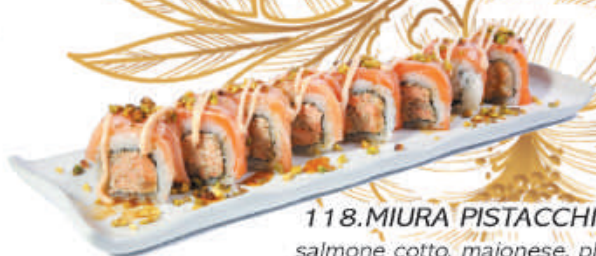
118.MIURA PISTACCHIO ROLL salmone cotto, maionese, philadelphia, sopra salmone scottato, spicy, pistacchio €10,00