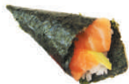
61.SALMONE salmone, avocado, sesamo €2,50

CONO DI ALGA NORI FARCITO CON RISO E PESCE -- 1 PZ.