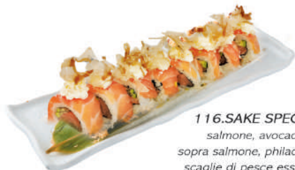
116.SAKE SPECIAL salmone, avocado sopra salmone, philadelphia, scaglie di pesce essiccato €12,00