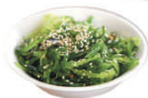
10. WAKAME insalata di alghe €4,00