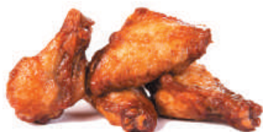
25. ALETTE DI POLLO 2pz - €3,00