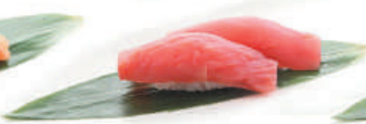
37.TONNO tonno €3,00