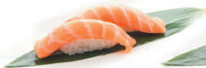
36.SALMONE salmone €2,50