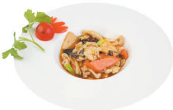
A43 POLLO FUNGHI E BAMBÙ pollo, bambù, funghi, carote, porro €4,50