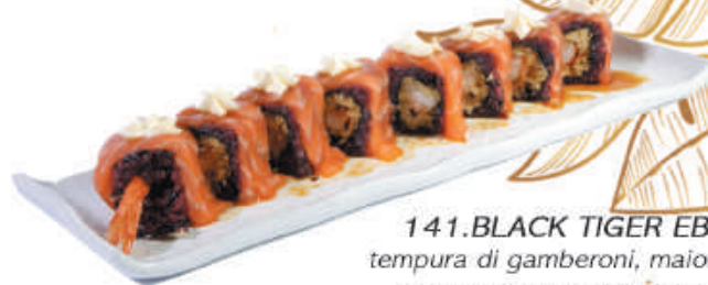
141. BLACK TIGER EBI tempura di gamberoni, maionese sopra salmone, philadelphia, salsa teriyaki €12,00