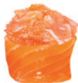
51.SAKE SPICY tartare di salmone, spicy, avvolto da salmone €5,00

RISO AVVOLTO DA PESCE O ALGA GUARNITO SOPRA - 2PZ