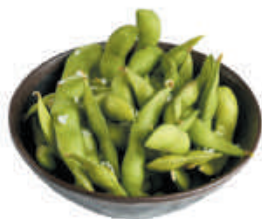
9. EDAMAME fagiolini di Soia €3,50