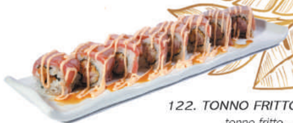
122. TONNO FRITTO ROLL tonno fritto, sopra tonno scottato, spicy, teriyaki €10,00