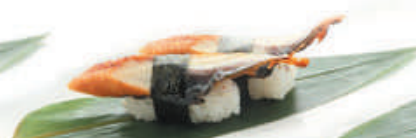
42.ANGUILLA anguilla €4,00