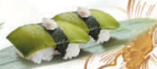
43.AVOCADO avocado €2,50