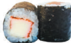
75. KANIKAMA surimi di granchio €4,00