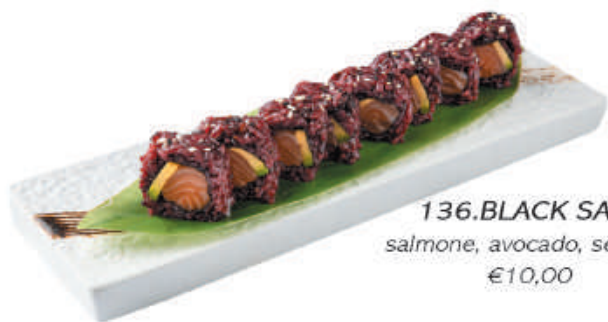
136. BLACK SAKE salmone, avocado, sesamo €10,00

ROLLS DI RISO NERO RIPIENI DI PESCE - 8PZ