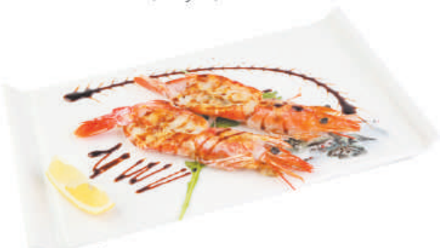
A74 Gamberoni alla piastra €7,00 gamberoni, teriyaki, sesamo