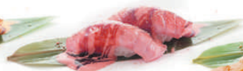
45.TONNO SCOTTATO tonno scottato, teriyaki €3,50