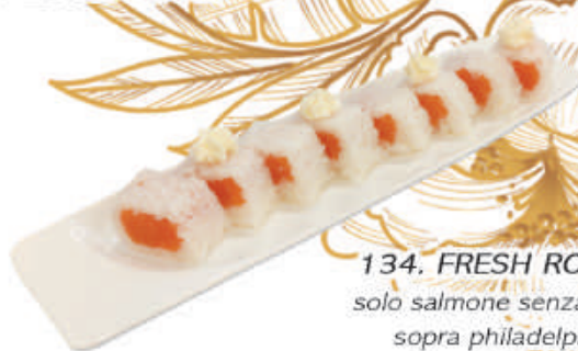
134. FRESH ROLL solo salmone senza alga, sopra philadelphia €8,50