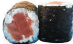
74. TEKA tonno €4,00