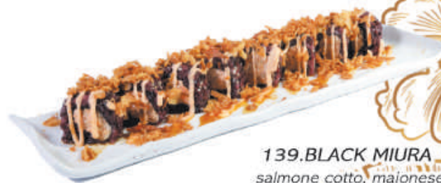
139. BLACK MIURA salmone cotto, maionese sopra cipolla fritta, spicy €11,00