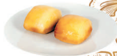
24. PANE FRITTO CINESE pane bianco al latte 2pz - €2,50