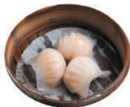
16. RAVIOLI DI GAMBERI gamberi, verdure 3pz - €2,50