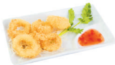
26. ANELLI DI CALAMARO €5,00