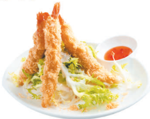
33. EBI TEMPURA