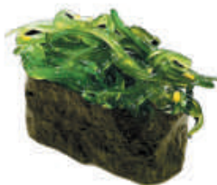
57.NORI WAKAME wakame, avvolto da alga nori €4,00