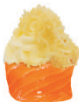
60.PHILA KATAIFI philadelphia, kataifi avvolto da salmone, €5,00