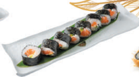
71. SAKE salmone, avocado, philadelphia €9,00