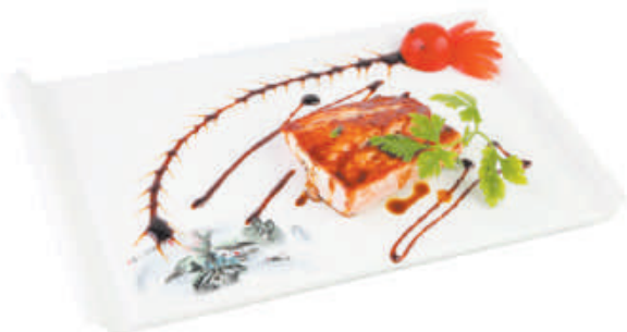
A72 Salmone alla piastra €8,00 salmone, teriyaki, sesamo