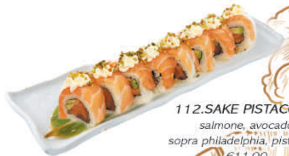
112.SAKE PISTACCHIO salmone, avocado sopra philadelphia, pistacchio €11,00