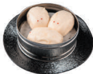
23. PANE DI CONIGLIO 2pz - €2,50