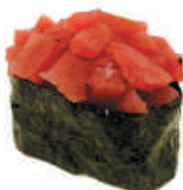
55.NORI MAGURO tartare di tonno, avvolto da alga nori €4,50