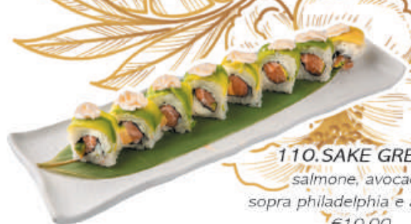
110.SAKE GREEN salmone, avocado sopra philadelphia e avocado €10,00