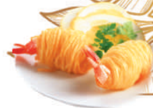
17. GAMBERI FILO gamberi, avvolti da patate 2pz - €4,50