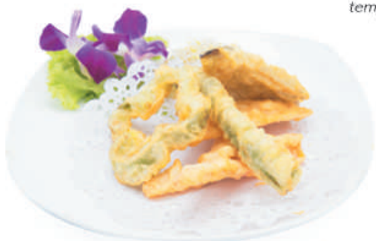
34. YASAI TEMPURA