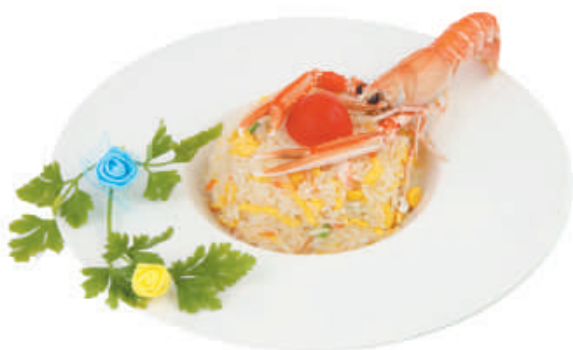
A20 Riso Cantonese €3,50 piselli, uovo, prosciutto.