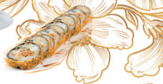
72. FRITTO salmone, avocado, philadelphia, teriyaki €10,00